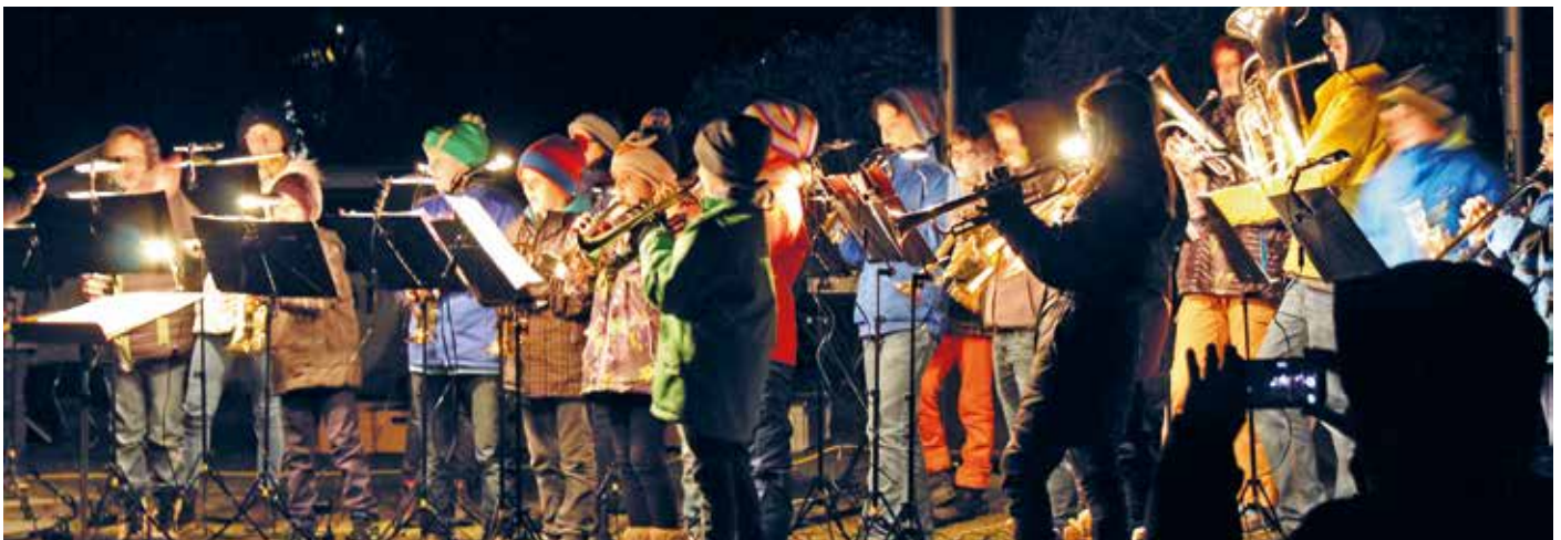
Die Mini Hoppers begrüßen die Kinder in der Arena