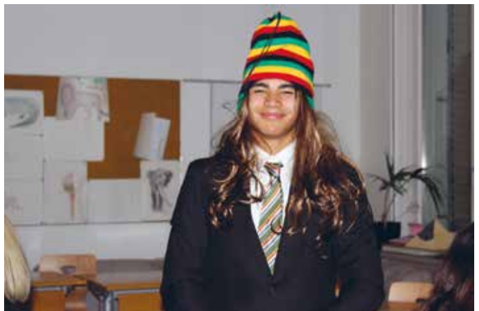
Gestylt und inkognito im Casino Boswil