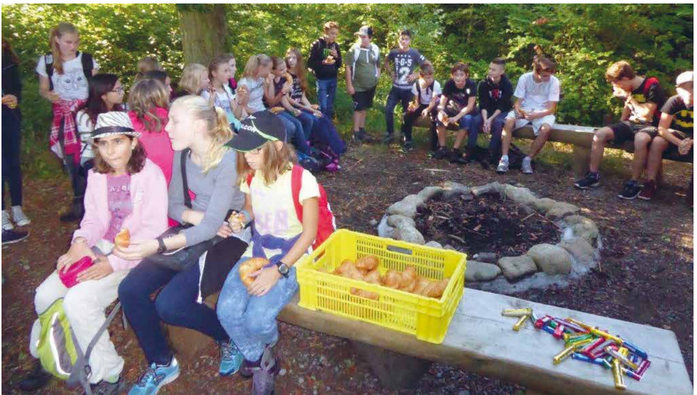
Power-Verpflegung bei der Waldhütte in Dintikon