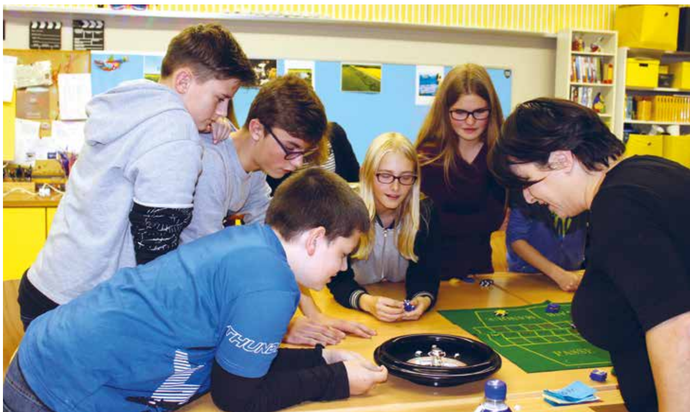
Auf welcher Zahl bleibt die Kugel im Roulette-Rad stehen?