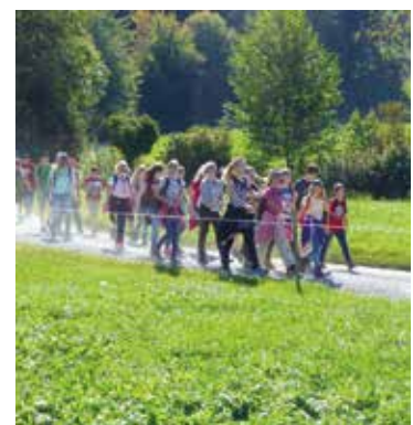
Gelungener Wandertag der Oberstufe Boswil

Im morgentlichen leichten Herbstnebel wurde dann die waldige Anhöhe des Lütlibuech erklommen, alles auf sicheren Waldwegen Richtung Ammerswil. Langsam übernahm der Sonnenschein das Wetterregime für den Tag und der Anstieg auf den Rietenberg konnte beginnen. Die Wege waren trocken, die Strecke abwechslungs-